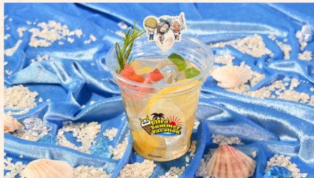
07 ベストジーニスト、エッジショット、ミルコのプロヒーローフレッシュコーディアルソーダ コーディアルハニレモン&ジンジャーソーダ+レモン+ぶどう+マンゴー+エディブルフラワー+ローズマリー+ホイップクリーム+もなか 750 (税込) 円