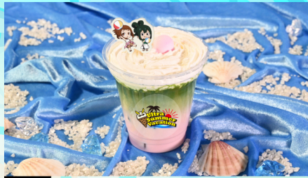
02 麗日お茶子と蛙吹梅雨のビーチバレーイチゴ抹茶ドリンク いちごミルク+グリーンティー+ホイップクリーム+ラムネ+もなか 750 (税込) 円