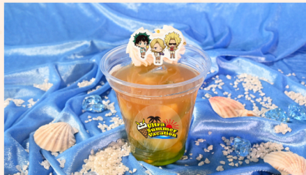
08 緑谷、青山、オールマイトのキラメキ! トロピカルアイスティー トロピカルアイスティー(パッションフルーツ・パイナップル)+マスカットシロップ+フルーツカクテル+ホイップ+アラザン+もなか 750 (税込) 円