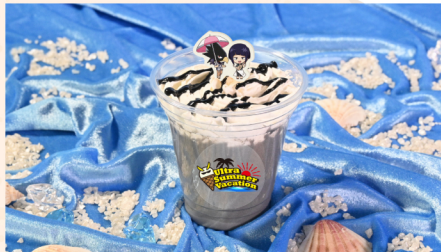
04 耳郎響香と常闇踏陰の心音深淵ゴマドリンク 黒ごまミルク+ホイップクリーム+黒ゴマソース+もなか 750 (税込) 円