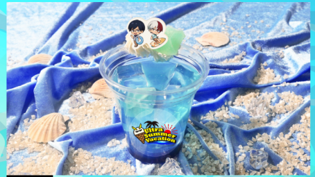
03 飯田天哉と轟焦凍の俊足冷却! ブルーフロズン グレープフルーツドリンク+ブルーシロップ+グレナデンシロップ+琥珀糖+ホイップクリーム+もなか 750 (税込) 円