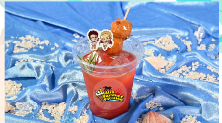
06 エンデヴァーとホークスの肉添え冷製スープ 冷製トマトスープ+つくね串+ローズマリー+もなか 750 (税込) 円