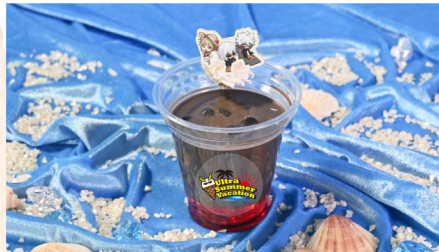
05 敵<ヴィラン>連合のブラックアイスココアドリンク 竹炭入りココア+ベリーゼリー+ホイップクリーム+もなか 750 (税込) 円